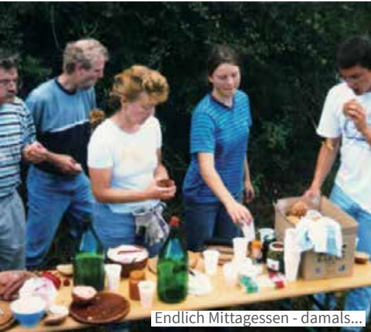
Endlich Mittagessen - damals...