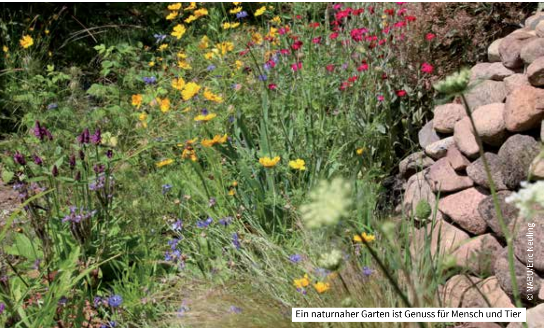
Ein naturnaher Garten ist Genuss für Mensch und Tier

Letztlich sind die Nachteile von Kiesgärten für die Natur und den Menschen gravierend. Es ist Zeit zum Umdenken, denn pflegeleichte, aber steinfreie Alternativen gibt es durchaus.