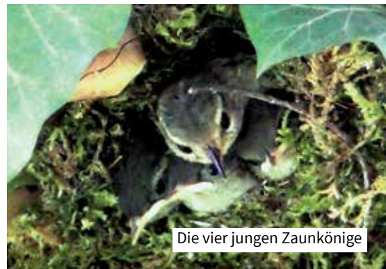
Die vier jungen Zaunkönige