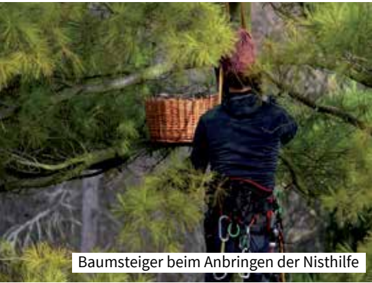
Baumsteiger beim Anbringen der Nisthilfe

Leider konnte dieses Jahr, wie befürchtet, die Brut eines Greifvogels in unserem Garten nicht wiederholt werden. Trotz der Mithilfe unserer neuen Nachbarinnen und einem Baumsteiger. An den Voraussetzungen ist es also nicht gescheitert. Denn wir konnten zumindest ein neues Nest anbieten. Aber es fand wohl nicht auf Anhieb den Gefallen von Waldohreule oder Turmfalke.