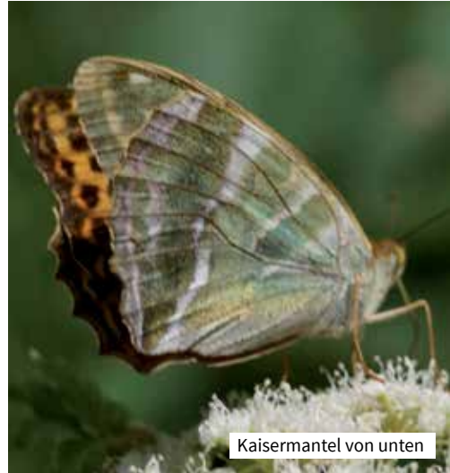
Kaisermantel von unten

Flügelspannweite 55 bis 65 mm. Beim Kaisermantel können Männchen und Weibchen insbesondere durch die deutlich ausgeprägten, beim Männchen vorhandenen Duftschuppen auf den Vorderflügeln unterschieden werden. Obwohl der Kaisermantel zu den Perlmutterfaltern zählt, zeigt er auf der Flügelunterseite keine Perlmutterflecken, sondern nur eine silberne Binde. Interessant ist das Balzverhalten. Das Männchen fliegt unter dem Weibchen hindurch und stimuliert es dabei mit Lockstoff aus seinen Duftschuppen.