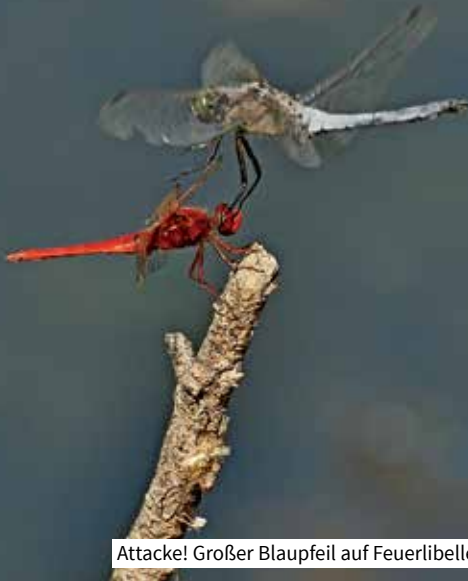
Angriff! Großer Blaupfeil auf Feuerlibelle