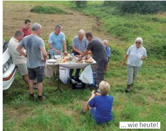
... wie heute!