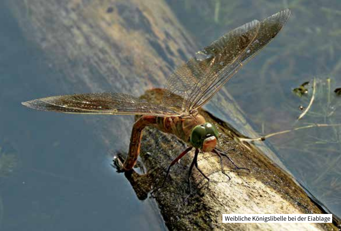
Weibliche Königslibelle bei der Eiablage