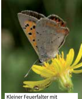
Kleiner Feuerfalter mit Veränderlicher Krabbenspinne