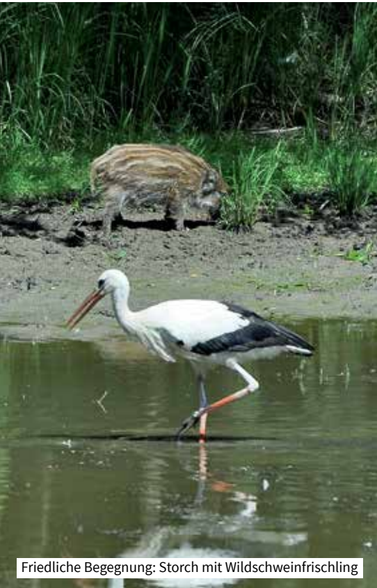
Friedliche Begegnung: Storch mit Wildschweinfrischling