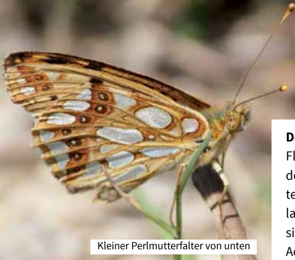
Kleiner Perlmutterfalter von unten

In Rheinland-Pfalz steht der Kleine Perlmutterfalter auf der Vorwarnliste (Rote Liste, RLP 2012). Insgesamt wird für diese Art in den letzten Jahren eine deutliche Bestandsabnahme beobachtet.