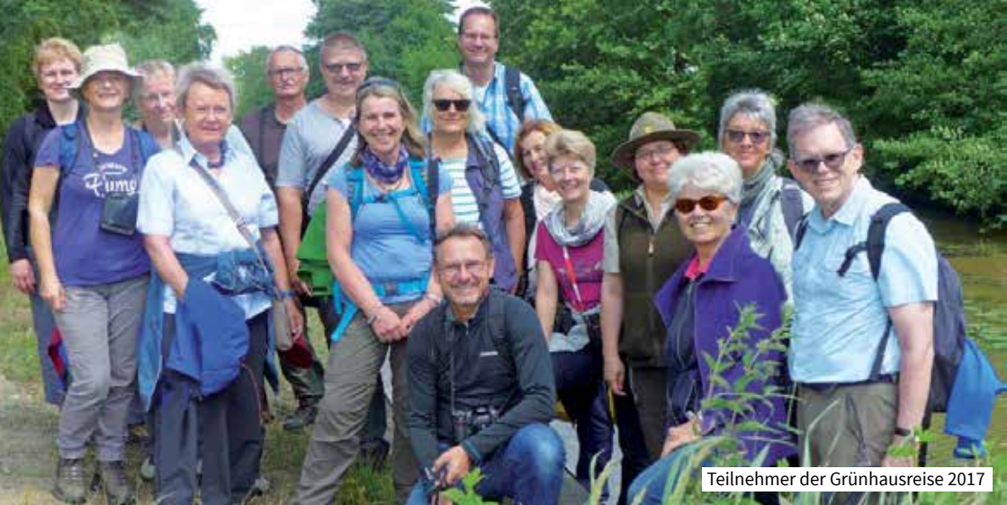
Teilnehmer der Grünhausreise 2017