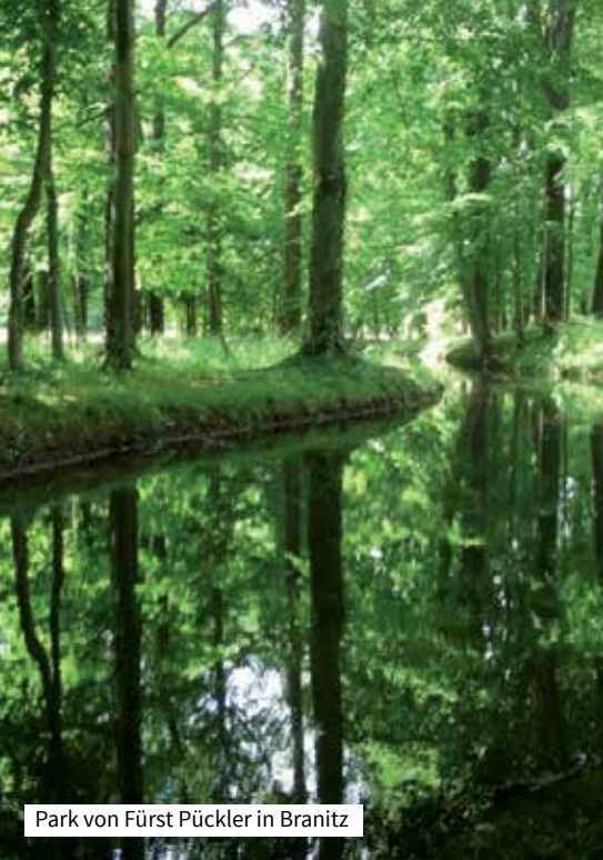
Park von Fürst Pückler in Branitz