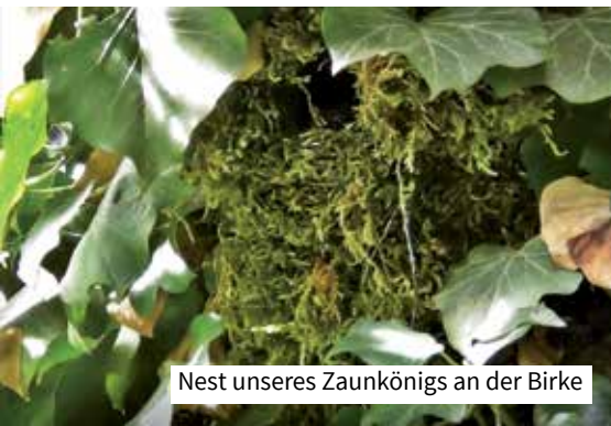
Nest unseres Zaunkönigs an der Birke

Das Brutgeschäft war hier aber schon im fortgeschrittenen Stadium, und so konnten wir den Nachwuchs des Öfteren ausgiebig bei der Fütterung und akrobatischen Übungen in und an der Mooshöhle beobachten. Sie waren schon recht groß. Vier junge Schreihälse konnten wir ausmachen.