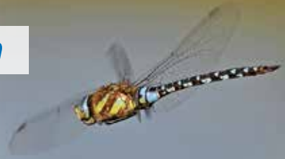
Große Königslibelle im freien Flug